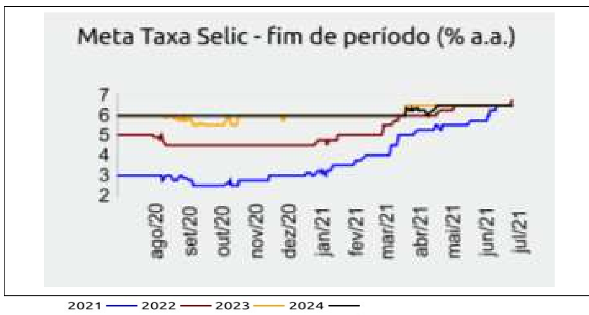
Figura 4: Projeções da Taxa de Juros Selic (% a.a.)