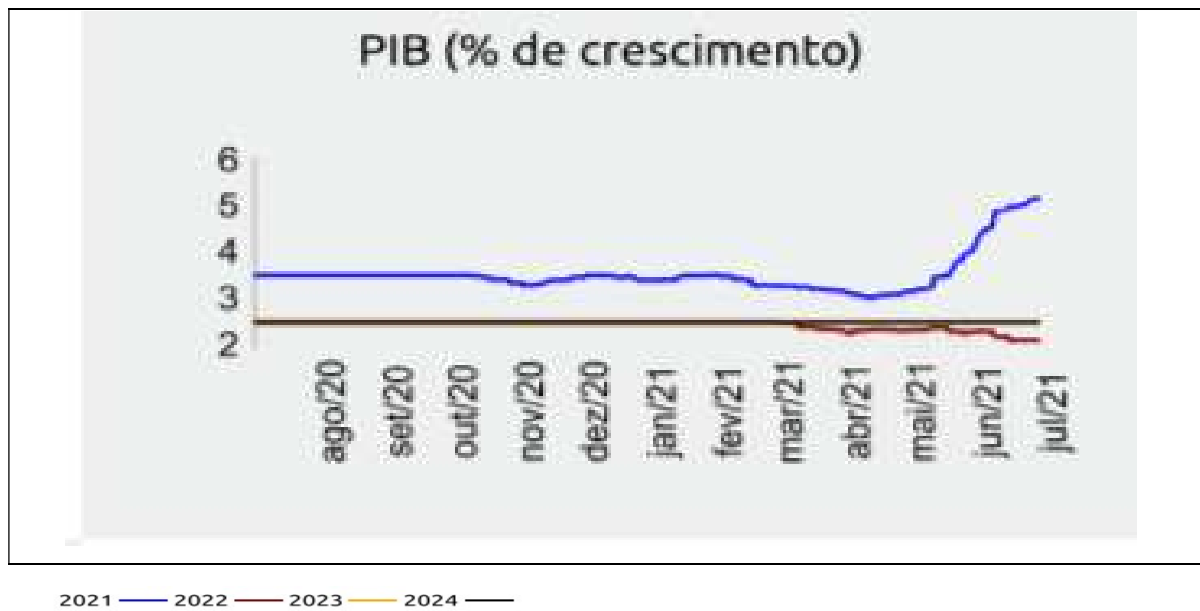
Figura 3: Projeções de Crescimento do PIB